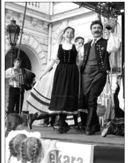
Die Ödenburger Deutsche Tanzgruppe trat beim Weinfest in der Heimatstadt auf.