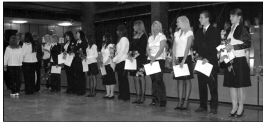
Übergabe der Sprachdiplome in Fünfkirchen