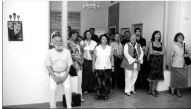
Zahlreiche Mitglieder der Künstlersektion fanden sich zur Vernissage im Haus der Ungarndeutschen in Budapest ein

Die Figurativität zum Beispiel ist in den heimatlichen oder ausländischen Landschaften von Jakob Forster stets präsent. Diesmal zeigt er unter dem Titel „Die französische Trikolore“ eine dicht bevölkerte mediterrane Meeresküste. Wie die malerische und farbenfrohe Pastelltech-